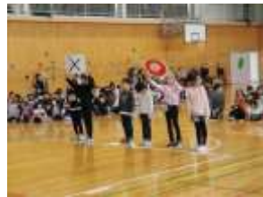
3年生「美幌小OXクイズ」