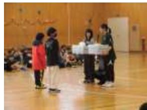
6年生「在校生へプレゼント」