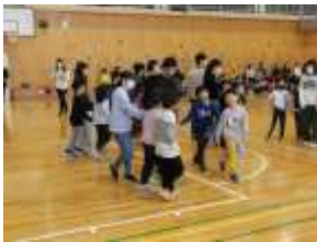
1年生「手つなぎ鬼ごっこ」

また、2/16(金)には、「6年生を送る会」を行いました。在校生は、6年生の卒業を祝うための催しを学年ごとに準備しました。一方、卒業生は、自分たちが縫った雑巾を在校生に贈りました。卒業を1か月後に控えた6年生は、在校生との楽しい時間を過ごし、思い出がまた一つ増えたようです。