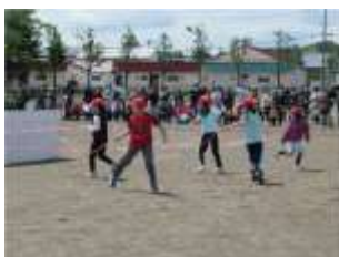
3年 「運命の赤いひも」