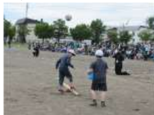
2年 「ナイスキャッチ」