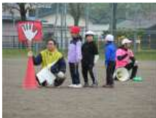
1年 「何がでるかな?じゃんけんぽん!」

雨天のため、1日延期して4日(日)の実施となった美小スポーツデー。どの学年の子どもたちも、全力で心を燃やし、これまでの自分を超えていこうとする姿が見られました。当日は、たくさん応援していただき、ありがとうございました。