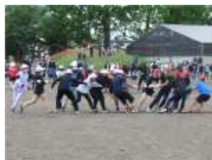
6年 「いっしょにひっぱりませんか?」